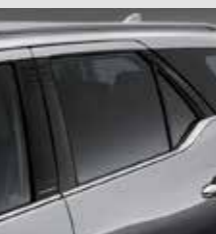
สติ๊กเกอร์ตกแต่งเสาประตู