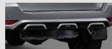
ชุดตกแต่งกันชนหลัง