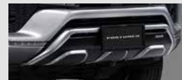
ชุดตกแต่งกันชนหน้า