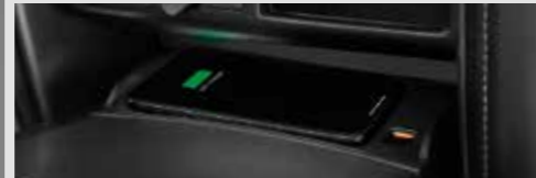
อุปกรณ์ชาร์จไฟแบบไร้สาย