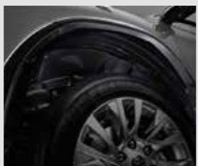
ชุดกันโคลนขุมล้อ