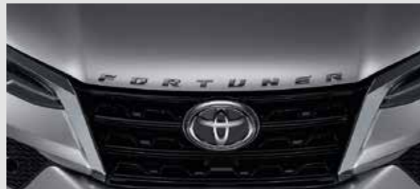
โลโก้ Fortuner (สีต่างงา / โครเมียม)