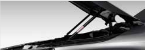
อุปกรณ์ช่วยผ่อนแรงเปิด-ปิด ฝากระโปรงหน้า