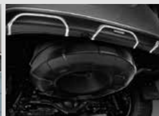
ชุดฝากรอบยางอะไหล่