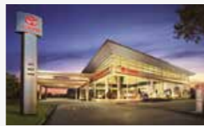
*ข้อมูล ณ เดือนมิถุนายน 2564

ด้วยใจเดียวกับที่เชื่อมั่นบริการให้เป็นมาตรฐานหนึ่งเดียว โดยถ่ายทอดวิสัยทัศน์และคุณบริการมาตรฐานถึง 465 แห่งทั่วประเทศ สู่ทุกทิศทั่วไทย คอยเปิดบริการให้คุณอุ่นใจ ไร้ขีดจำกัดการเดินทาง