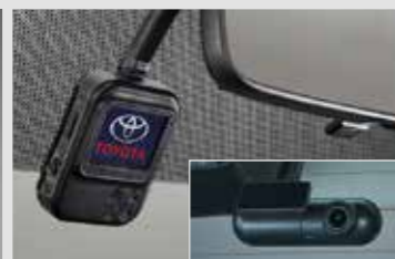
กล้องบันทึกภาพด้านหน้าและหลัง