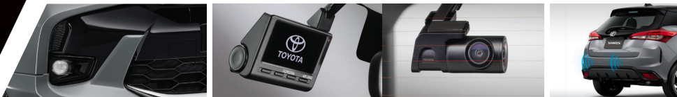
ชุดไฟตัดหมอก LED พร้อมกรอบครอบ