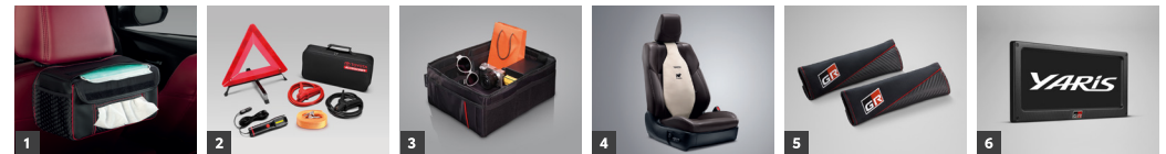
1. ฝาคลุมกล่องกระดาษทิชชูพร้อมที่ใส่หน้ากากอนามัย 2. ชุดอุปกรณ์ฉุกเฉิน (แบบกระเป๋าน้ำ) 3. กล่องเก็บของอนกประสงค์ภายในรถ 4. เบาะรองหลังเพื่อสุขภาพ 5. ปลอกหุ้มพนักพิงเบาะ GR 6. กรอบป้ายทะเบียน GR

อุปกรณ์ตกแต่งแท้โตโยต้ารับประกันสูงสุด 3 ปี หรือ 100,000 กม. (ตามรุ่นรถยนต์ที่บริษัทฯ กำหนด โปรดศึกษารายละเอียดจากผู้ถือการรับประกันคุณภาพ และผู้ถือการใช้งานรถยนต์)