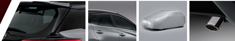
ชุดตกแต่งเสริมสปอยเลอร์หลังคา แฝงบังแดดข้าง