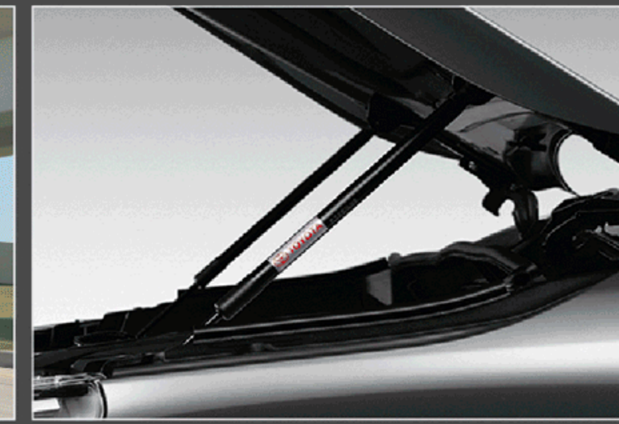
อุปกรณ์ช่วยผ่อนแรงเปิด-ปิดฝากระโปรงหน้า