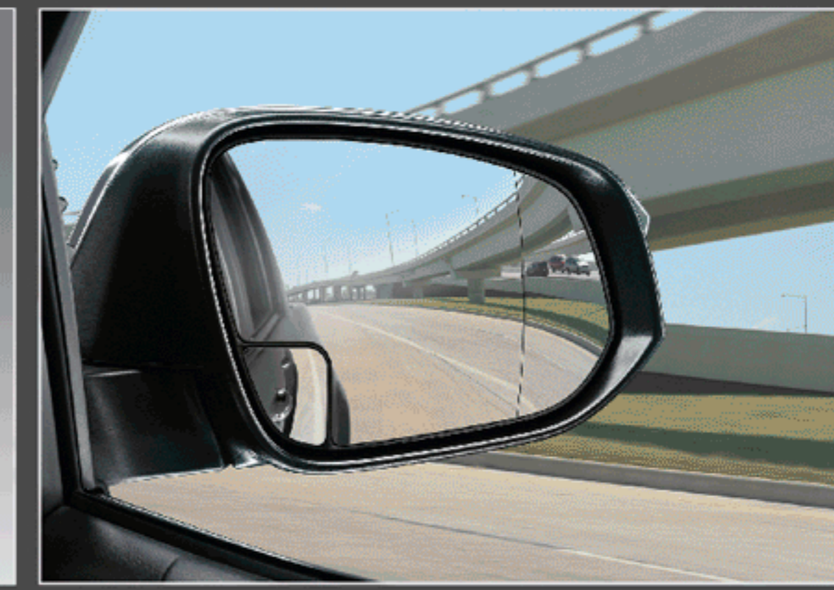
กระจกข้างช่วยมองมุมอับสายตา