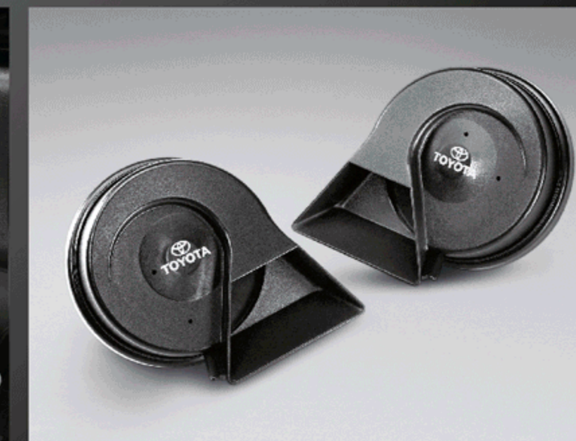
ชุดสัญญาณแตร