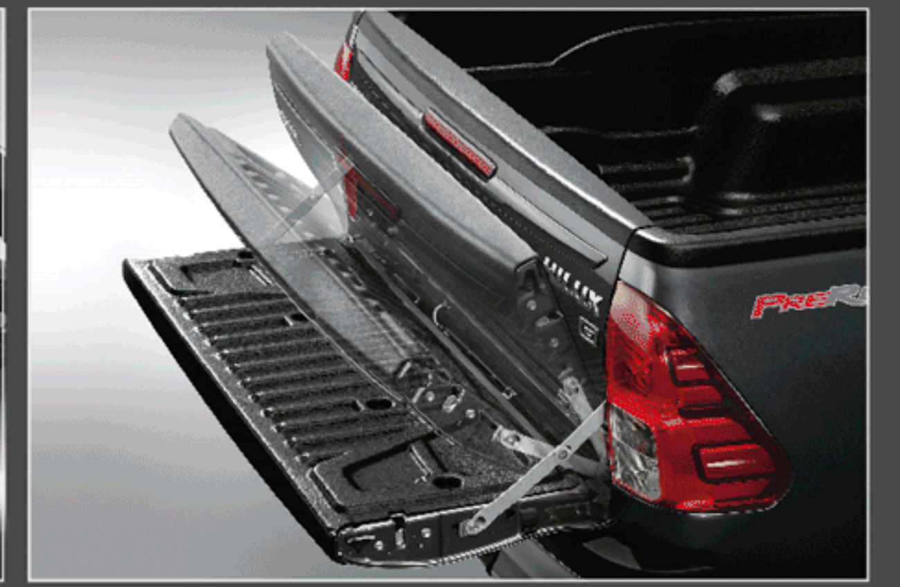
อุปกรณ์ช่วยผ่อนแรงเปิด-ปิดฝาท้ายกระบะ