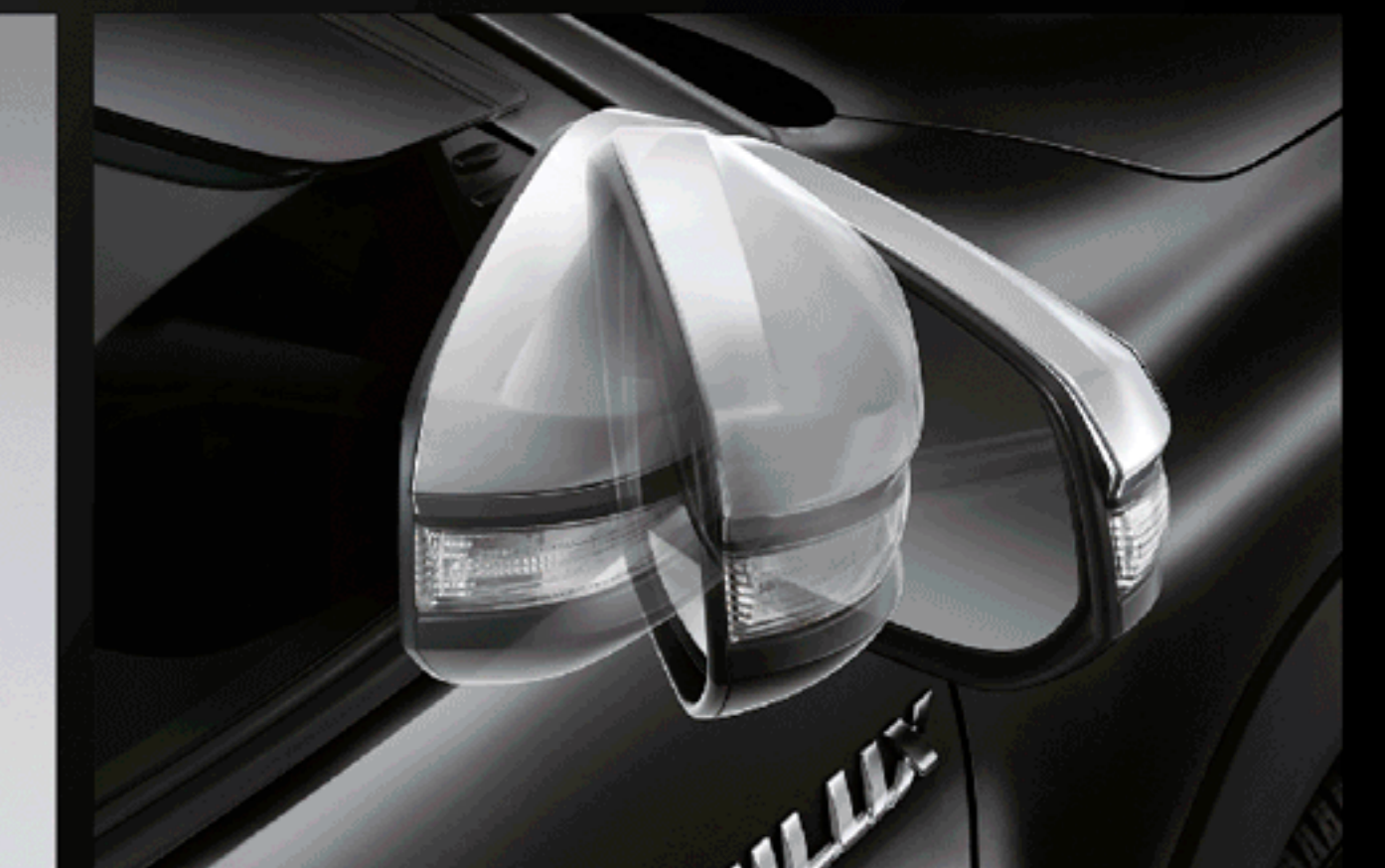
ชุดควบคุมระบบพับกระจกอัตโนมัติ

อุปกรณ์ตกแต่งแท้โตโยต้ารับประกันสูงสุด 3 ปี หรือ 100,000 กม. (ตามรุ่นรถยนต์ที่บริษัทฯ กำหนด โปรดศึกษารายละเอียดจากคู่มือรับประกันคุณภาพ และคู่มือการใช้งานรถยนต์)