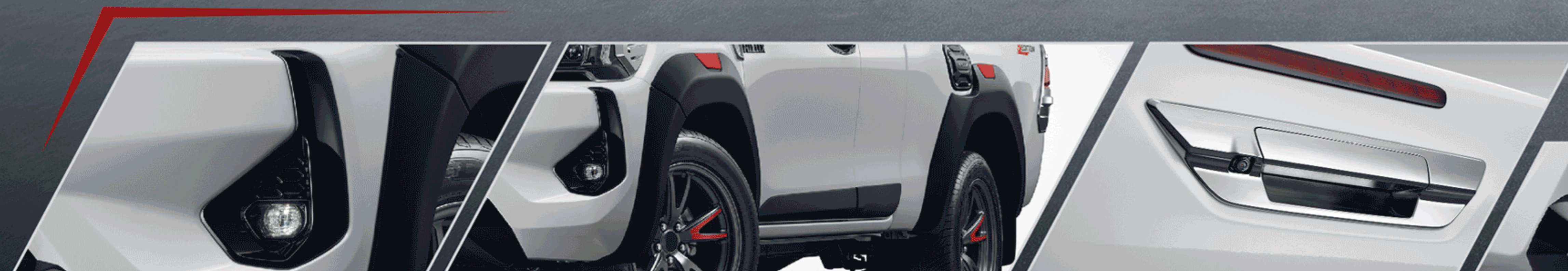
ชุดไฟตัดหมอก LED