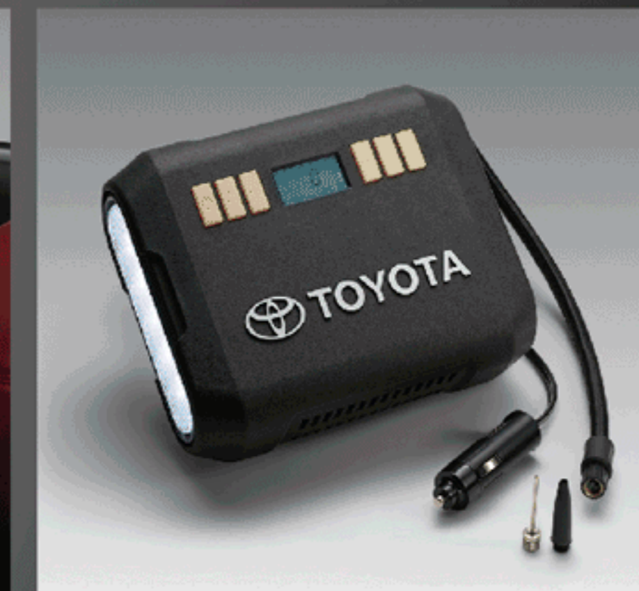
ชุดอุปกรณ์เต็มมยาง (แบบดิจิทัล) ver. 2