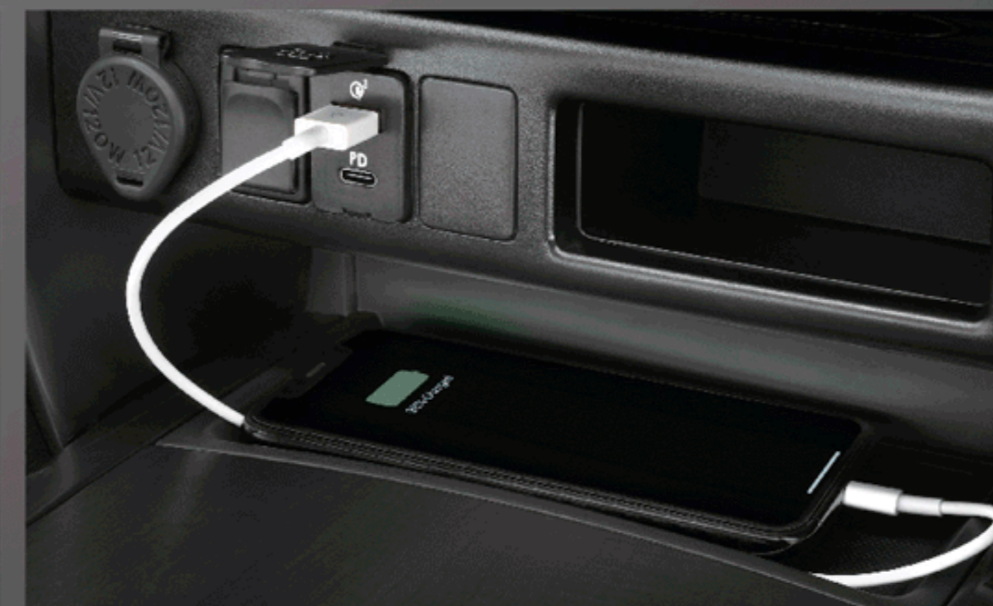
ที่ชาร์จภายในรถยนต์ (USB)