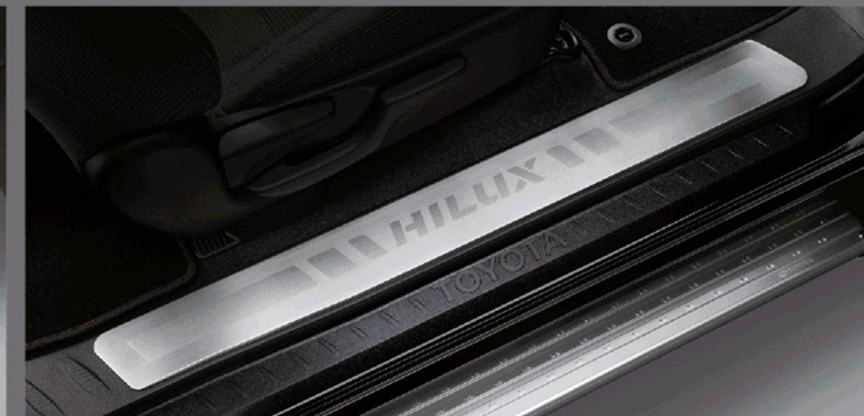
สคัฟิวลา รุ่นสมาร์ท แค็บ