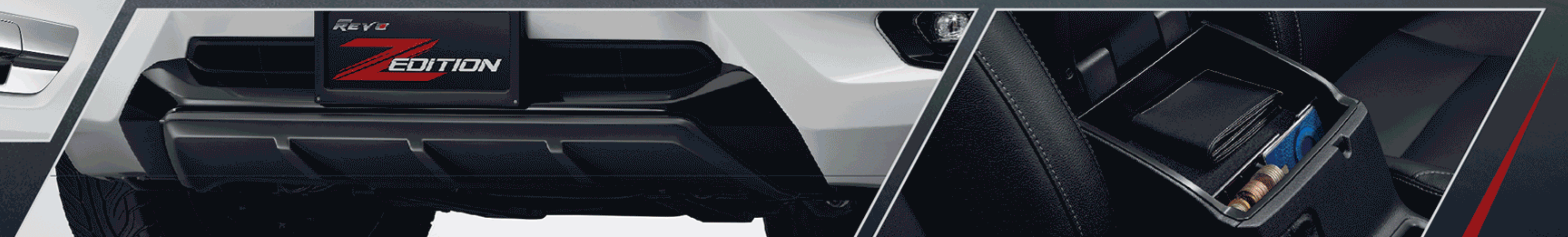
ชุดตกแต่งกับชนหน้า