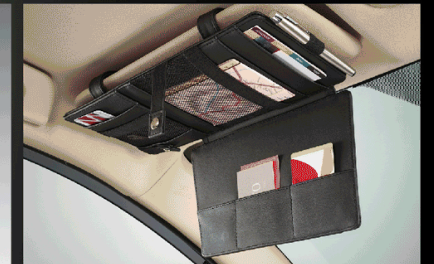
แผงบังแดดคอนทอปประสงค์