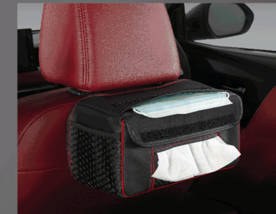
ผ้าคลุมกล่องกระดากิซซู พร้อมที่ใส่หน้ากากอนามัย