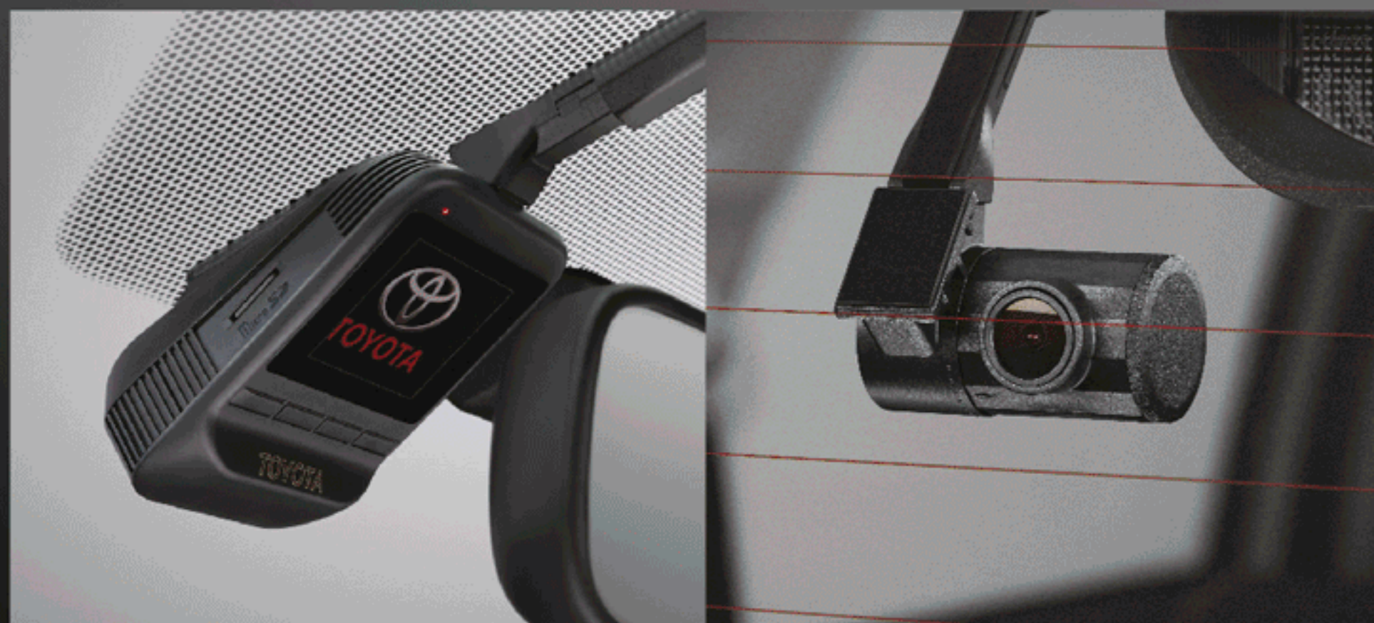
กล้องบันทึกภาพด้านหน้า รุ่นสมาร์ท แค็บ / รุ่นดับเบิล แค็บ กล้องบันทึกภาพด้านหน้า-หลัง รุ่นดับเบิล แค็บ