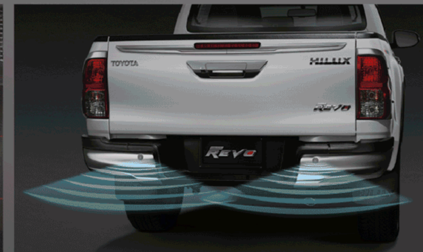
สัญญาณเตือนกระแทกท้ายรถ