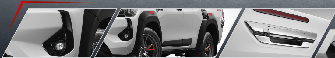
ชุดไฟตัดหมอก LED