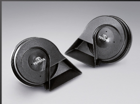
ชุดสัญญาณแตร