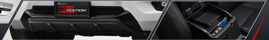
ชุดตกแต่งกันชนหน้า