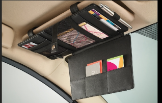
แผงบังแดดนอกประ-สنگค์