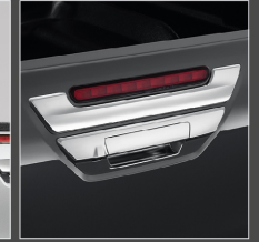
คิ้วไฟเบรกดวงที่สาม โครเมียม