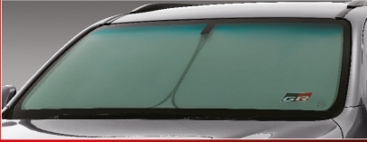
ที่บังแดดด้านหน้า GR