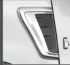
คิ้วตกแต่งซุ้มล้อ โครเมียม