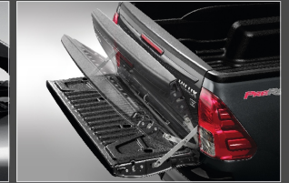
อุปกรณ์ช่วยผ่อนแรง เปิด-ปิดฝาท้ายกระบะ-