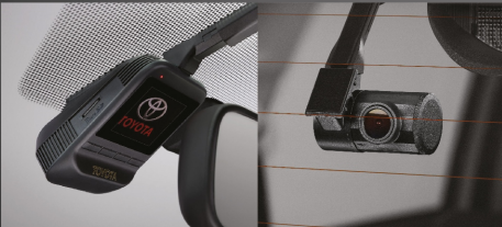
กล้องบันทึกภาพด้านหน้า รุ่นสมาร์ท แค็บ / รุ่นดับเบิล แค็บ กล้องบันทึกภาพด้านหน้า-หลัง รุ่นดับเบิล แค็บ