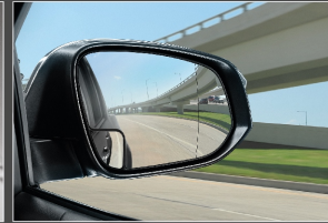
กระจกข้างช่วยมองมุมอับสายตา