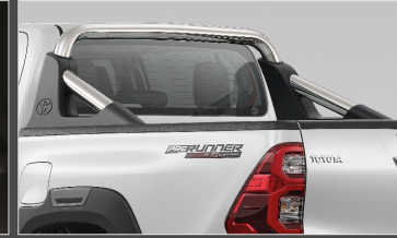
สไลด์ลิทบาร์