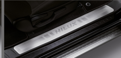
สคิปพลาท รุ่นสมาร์ท แค็บ