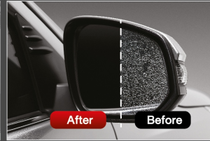
แผ่นฟิล์มกันน้ำเกาะกระจกมองข้าง