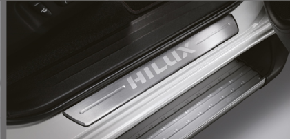
สคิปพลาท รุ่นดับเบิล แค็บ