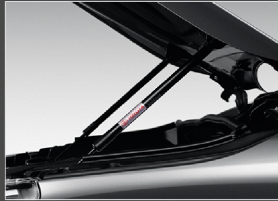
อุปกรณ์ช่วยผ่อนแรง เปิด-ปิดฝากระโปรงหน้า