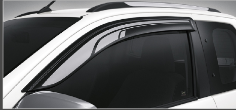
แผงบังแดดข้าง (แบบลายสกรีน) รุ่นสมาร์ท แค็บ