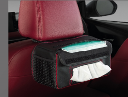
ผ้าคลุมกล่องกระดาดกึ่งซู พร้อมที่ใส่หน้ากากอนามัย