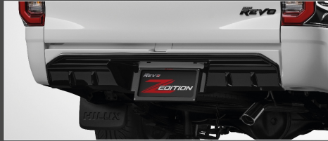
ชุดตกแต่งกันชนท้ายสีขาว