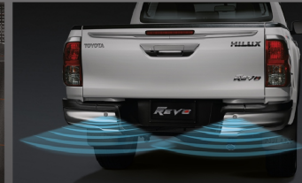
สัญญาณเตือนกระ-ระ-ท้ายรถ