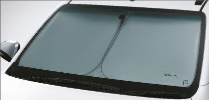
ที่บังแดดด้านหน้า