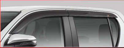
แผงบังแดดข้าง GR รุ่นดับเบิล แค็บ