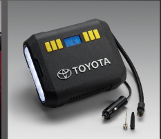
ชุดอุปกรณ์เติมลมยาง (แบบดิจิทัล) ver. 2