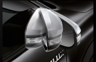
ชุดควบคุมระบบพื้บกระ-จกอัตโนมัติ

อุปกรณ์ตกแต่งแท้โตโยต้ารับประกันสูงสุด 3 ปี หรือ 100,000 กม. (ตามรุ่นรถยนต์ที่บริษัทฯ กำหนด โปรดศึกษารายละเอียดจากคู่มือรับประกันคุณภาพ และคู่มือการใช้งานรถยนต์)