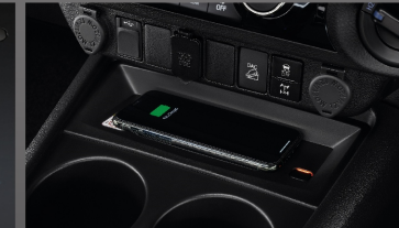
อุปกรณ์ชาร์จไฟแบบไร้สาย