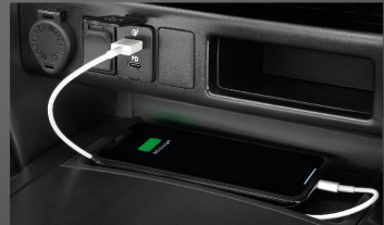
ที่ชาร์จภายในรถยนต์ (USB)