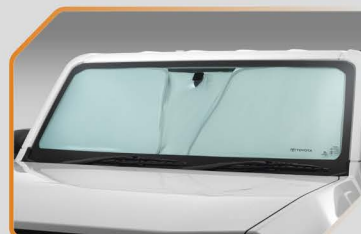
ที่บังแดดด้านหน้า