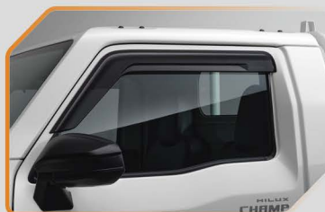
แผ่นบังแดดข้าง