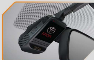
กล้องบันทึกภาพด้านหน้า