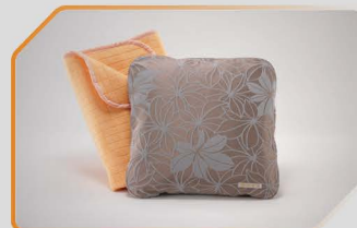
หมอนนอกประสะงค์ (แบบพิเศษ)

อุปกรณ์ตกแต่งแท้โตโยต้ารับประกันสูงสุด 3 ปี หรือ 100,000 กม.