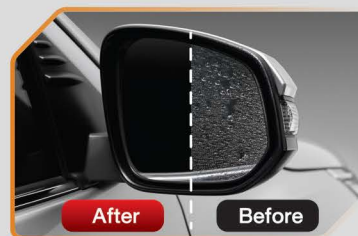
แผ่นฟิล์มกันน้ำเกาะกระจกรมองข้าง