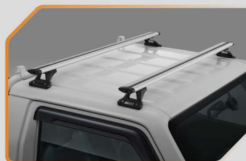
แร็คหลังคา