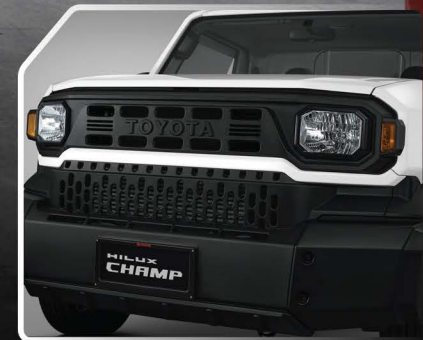
ชุดตกแต่งกระจังหน้า (สีเทา / สีเงิน / สีขาว / สีขาวซูปเปอร์ไวท์)

หมายเหตุ : 1) ภาพข้างต้นเป็นเพียงภาพตัวอย่างเท่านั้น รายละเอียด หรืออุปกรณ์บางส่วนในภาพ อาจแตกต่างจากที่จำหน่ายจริง หากสนใจอุปกรณ์ตกแต่งใดๆ สอบถามรายละเอียดเพิ่มเติมได้ที่ผู้แทนจำหน่ายโตโยต้า 2) ล้ออัลลอย และยางที่ปรากฏในภาพข้างต้นไม่ได้จัดจำหน่ายโดยบริษัท โตโยต้า มอเตอร์ ประเทศไทย จำกัด