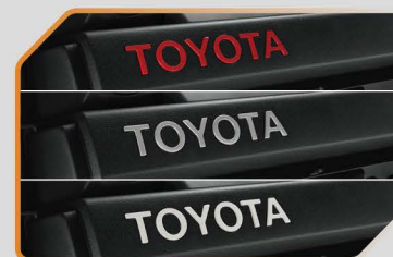
โลโก้ TOYOTA บนคอนโซลหน้า (สีแดง / สีเงิน / สีขาว)