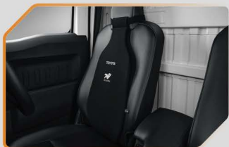
เบาะรองหลังเพื่อสุขภาพ (สีดำ)