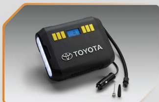
ชุดอุปกรณ์เติมลมยาง (แบบดิจิทัล) ver.2