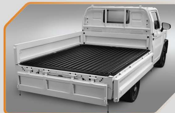
พื้นปูกระบะเฉพาะพื้น