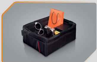
กล่องเก็บของนอกประสะงค์ ภายในรถ