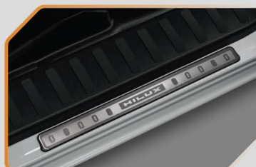
สคัฟิวาน