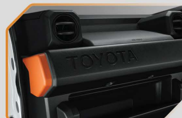
ชุดตกแต่งแผงคอนโซลหน้า