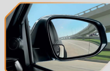
กระจกข้างช่วยมองมุมอับสายตา