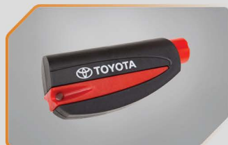
พวงกุญแจรถกุญแจฉุกเฉิน