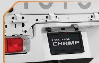
กล้องมองหลัง