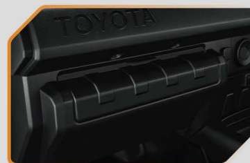
ฝาปิดลิ้นชักหน้า