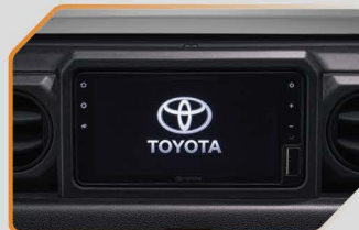
เครื่องเล่นวิทยุพร้อมจอ