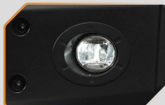
ชุดไฟตัดหมอก LED