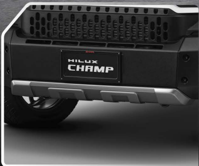
ชุดตกแต่งกันชนหน้า