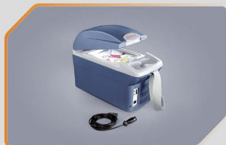
กล่องรักษาอุณหภูมิ