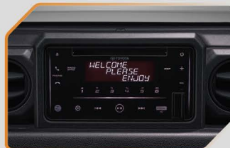
เครื่องเล่นวิทยุ