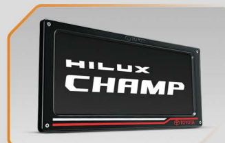
กรอบป้ายทะเบียน (แบบสกรีนสี)