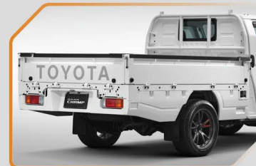
แผงตกแต่งกระบะด้านข้างและท้าย