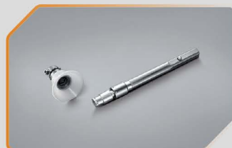
อุปกรณ์ล็อกยางอะไหล่ (แบบป้องกันการหมุนลง)