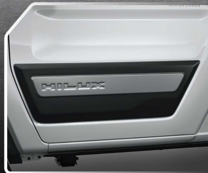
คิ้วตกแต่งด้านข้าง