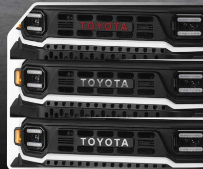
ไฟโก้ TOYOTA บนกระจังหน้า (สีแดง / สีเงิน / สีขาว)