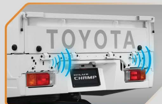
สัญญาณเตือนกะระยะท้ายรถ