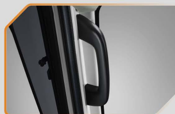
ราวมือจับ