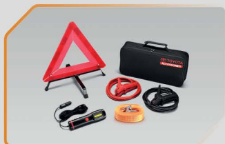
ชุดอุปกรณ์ฉุกเฉิน (แบบกระเป๋าผ้า)