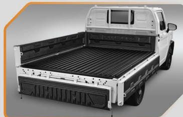
ชุดพื้นปูกระบะ