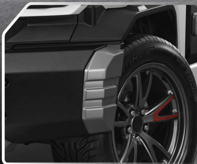
ชุดตกแต่งมุมกันชนหน้า