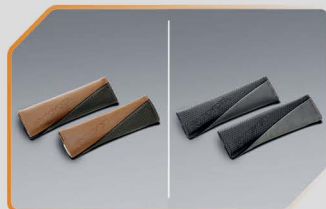
ปลอกหุ้มเบาะนิรภัย (สีครีม / สีดำ)