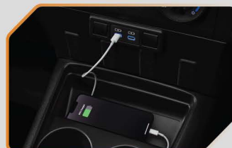
ที่ชาร์จภายในรถยนต์ (USB)