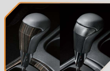
หัวเกียร์อัตโนมัติ (ลายไม้ / ลายสปอร์ต)