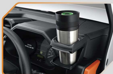
ที่วางแก้ว