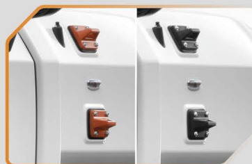
ชุดตะขอเนกประสงค์ (สีส้ม / สีดำ)