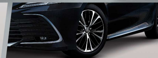
ล้ออัลลอย 18 นิ้ว