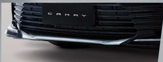
คิ้วโครเมียมกันชนหน้า