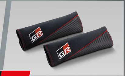
พรมปูพื้นนิรภัย GR