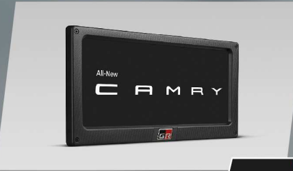
กรอบป้ายทะเบียน GR