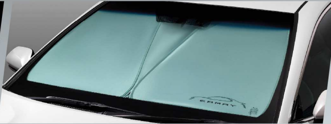
ที่บังแดดด้านหน้า