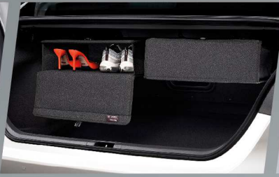
กล่องแขวนอเนกประสงค์ท้ายรถ