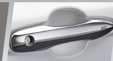
แผ่นฟิล์มกันรอยเข้ามือจับประตู