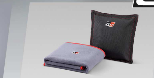
หมอนอเนกประสงค์ GR แบบ 2in1