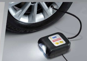
ชุดอุปกรณ์เติมลมยาง (แบบดิจิทัล)