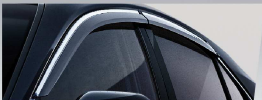
แผงบังแดดข้างคิ้วโครเมียม