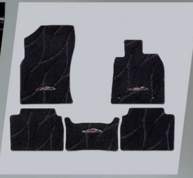
พรมปูพื้นรถยนต์แบบพิเศษ