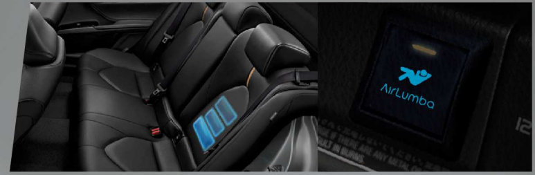
ระบบบริหารหลังไฟฟ้า (บริเวณหลังส่วนล่าง)