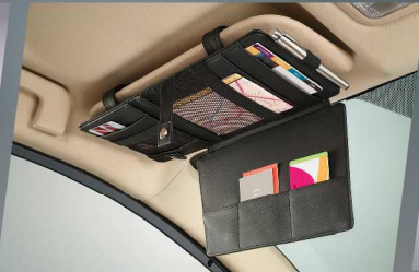
แผงบังแดดอเนกประสงค์