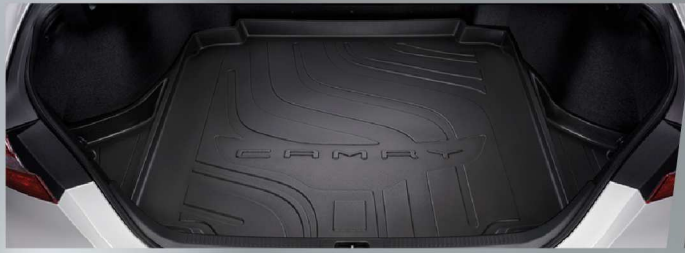
ถาดใส่ของท้ายรถ