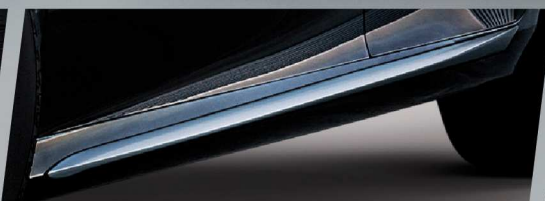
คิ้วโครเมียมตกแต่งด้านข้าง