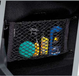
ตาข่ายเก็บของท้ายรถ ด้านข้าง