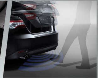
ชุดเซ็นเซอร์เปิดฝาท้าย