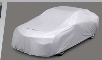
ผ้าคลุมรถ