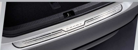
แผ่นกันรอยขอบกันชนท้าย