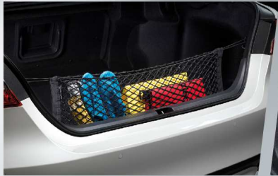
ตาข่ายเก็บของท้ายรถ