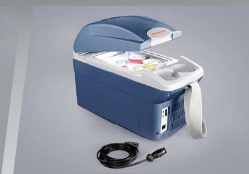
กล่องรักษาอุณหภูมิ