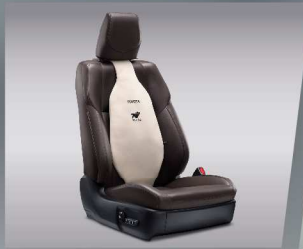
เบาะรองหลังเพื่อสุขภาพ