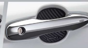
กรอบรองที่จับประตูลายเคฟล่า