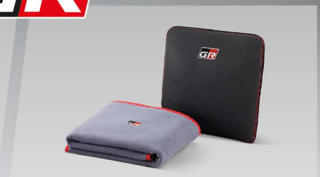
หมอนอเนกประสงค์ GR แบบ 3in1