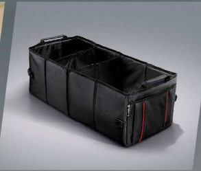
กล่องเก็บของอเนกประสงค์