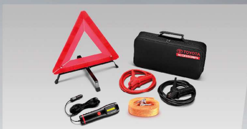
ชุดอุปกรณ์ฉุกเฉิน (แบบกระเป๋าผ้า)