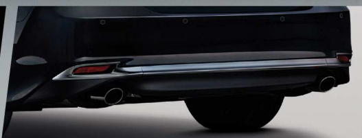
คิ้วโครเมียมกันชนท้าย