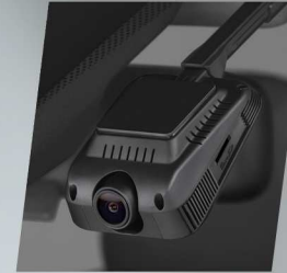
กล้องบันทึกภาพด้านหน้า