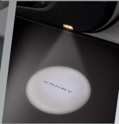
ไฟส่องสว่างที่ประตู หน้าแบบ LED