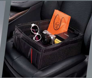
กล่องเก็บของอเนกประสงค์ ภายในรถ